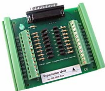
Expansion Unit für AD_USB-Box (im Lieferumfang enthalten)

Die AD_USB-Box verfügt über 8 massebezogene (single-ended) bzw. 4 differentielle analoge Eingänge sowie 4 digitale Eingänge. Weitere 16 digitale Eingänge werden über die zum Lieferumfang gehörende Expansion Unit bereitgestellt. Diese Eingänge sind zusätzlich kurzschluss- und überspannungsgeschützt.